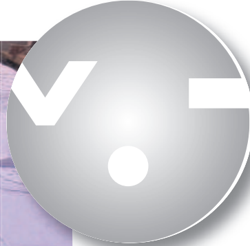
Visualisierungsmodell zur Überdeckung der A81